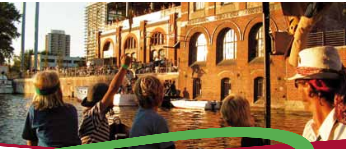
siehe Seite 26

täglich 10 bis 20 Uhr (letzter Einlass 19 Uhr)