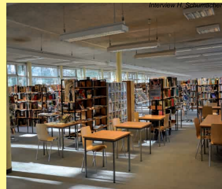
Innenansicht der Stadtteilbibliothek